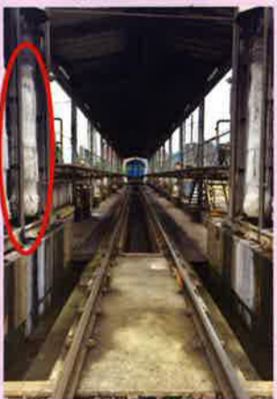
ここにあるローラーが回転するよー

お客様を運び終わったら、列車は車庫にかえります。車庫で列車をあらうときは、写真にあるふわふわしたローラーが回転して列車を自動であらってくれます。その後、燃料をほじゅうします。燃料は50リットルもはあります。なんと自動はんばいきの飲み物（500ml）104こぶんです。