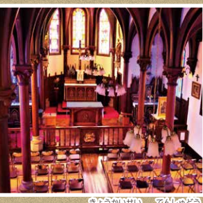
▲カトリック宮津教会聖ヨハネ天主堂 フランス式の建築様式に荘厳さの室内という、ユニークな教会です。

列車の発着時刻を知る時に役立つ時刻表ですが、目的地に着きたい時間から考えて、何時の列車に乗れば良いかを調べたことはありますか？遠くにお出かけする際は、列車を乗り継ぐ場合もあります。時刻表を使うと、遠くへの旅行やお買い物をする際も役立ちます！さあ、時刻表で調べてみんなで出かけよう！