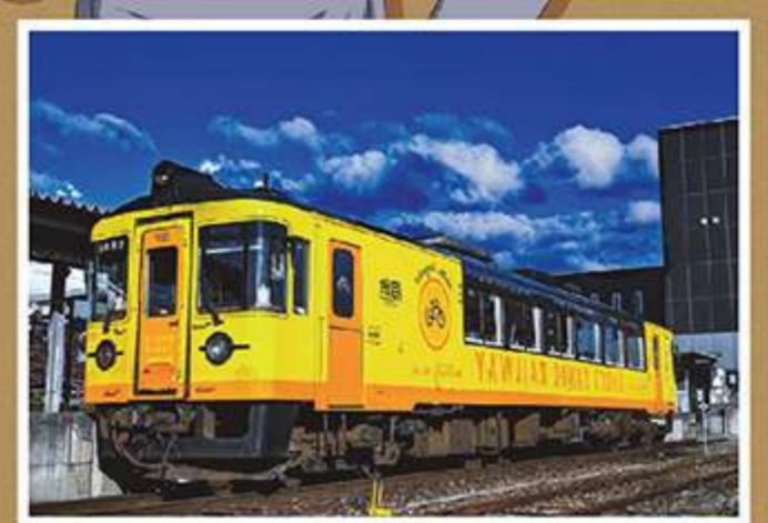
⑨丹後サ〇クルトレイン