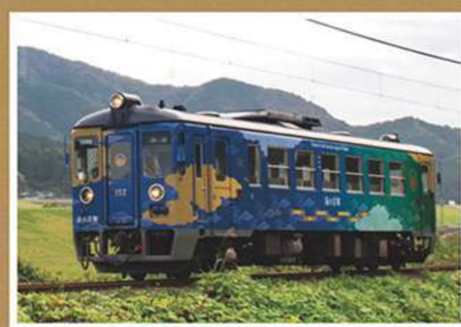
⑧海のき〇〇とトレイン