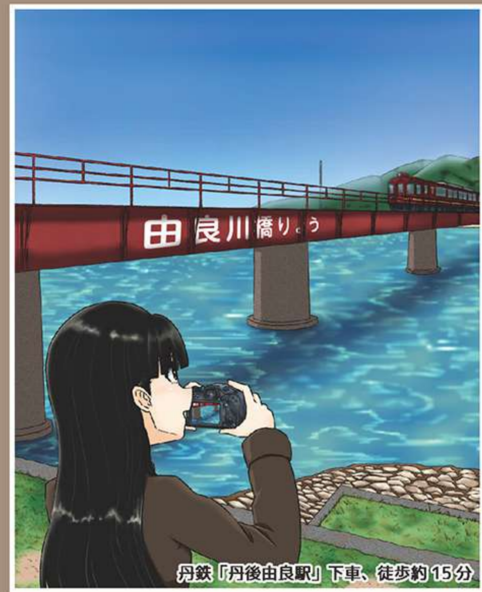
丹鉄「丹後由良駅」下車、徒歩約15分

丹鉄花子ちゃんは、由良川橋梁を走る写真を撮るために、福知山駅から丹後由良駅に京都丹後鉄道に乗って向かいます。