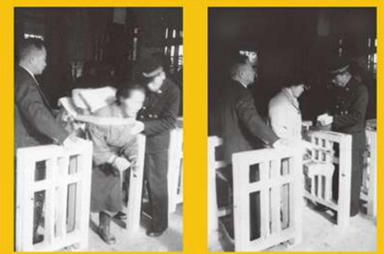
【宮津市教育委員会】