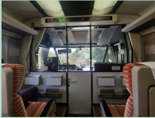
▲先頭の座席の風景