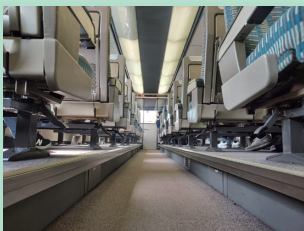
▲座席の床が高くなっているハイデッカー構造