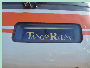
▲ヘッドマークにTANGO RELAY (たんごリレー) の文字