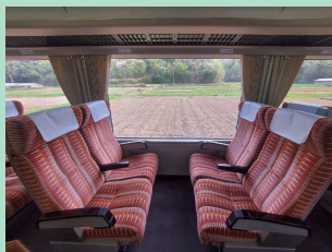
▲広々とした車内の風景