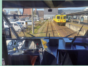
▲乗務員室から見える景色