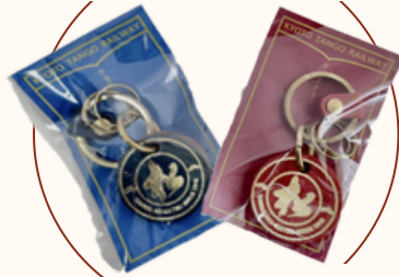
牛革キーホルダー