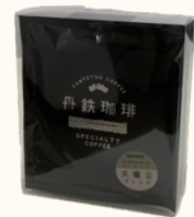
丹鉄珈琲5種 ドリップパックセット