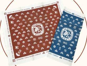
てめぐいハンカチ