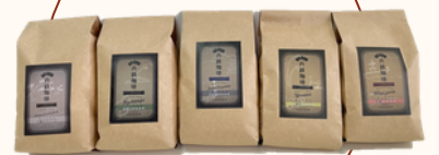
丹鉄珈琲 ブレンド豆5種