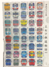
クリアファイル 3セク鉄道物語