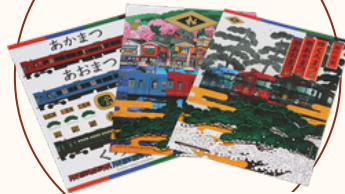
ポストカード 3枚セット