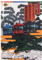
クリアファイル 水戸岡さんデザイン